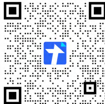
新生拍摄工作爱好者预报名