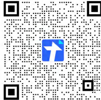
新生迎新志愿者预报名