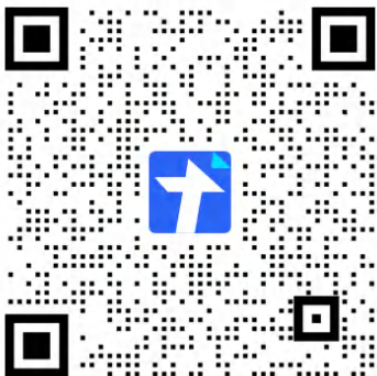
新生艺术表演活动预报名