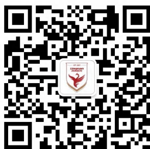
岭南学生社区公众号