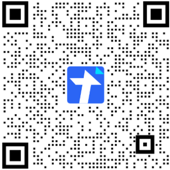
新生学生干部预报名