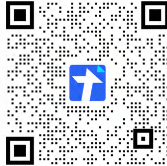
武装部新生退伍兵预报到